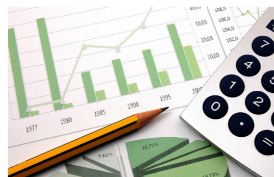
5. Estado de flujos de efectivo