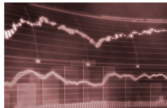
3. Pérdidas y Ganancias